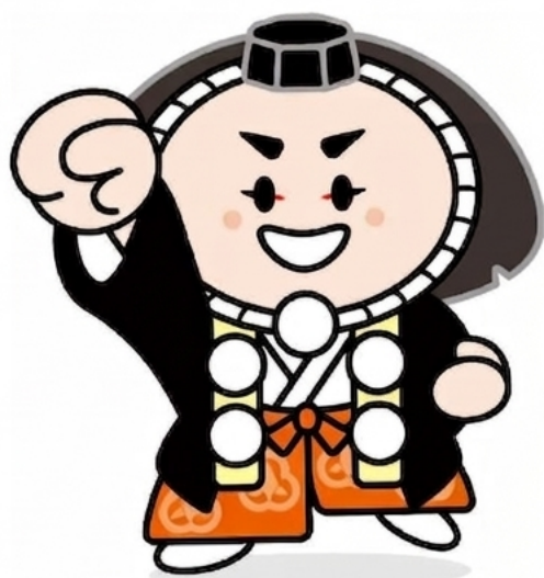
小松市イメージキャラクター 「カブキエー」

期 日 令和8年5月9日(土)・10日(日) 会 場 小 松 総 合 体 育 館 主 催 石 川 県 ジュニアバドミントン連盟 主 管 小 松 ジュニアバドミントンクラブ 小 松 市 バドミントン協会 後 援 石 川 県 バドミントン協会 北 國 新 聞 社 北 陸 放 送 協 賛 株 式 会 社 ゴ ー セ ン 株 式 会 社 プ ロ フ ォ ト サ ニ ー